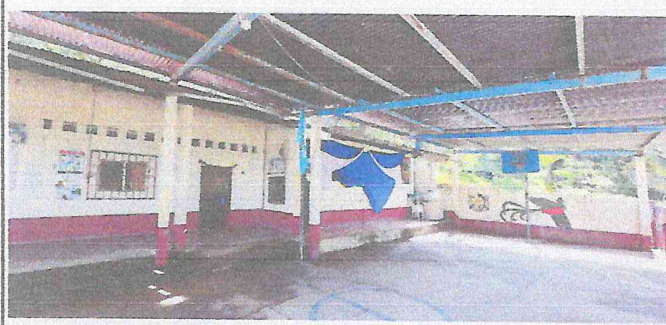
Foto 1: Estructura de Techo deteriorada Laminas Oxidadas y rotas por tiempo